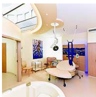
Wochenbett-Sprechstunde im Kreißsaal Do 9-12 Uhr 02305-294-5385